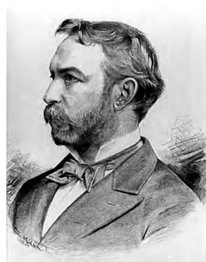
František Adolf Šubert

Lit.: Encyklopedie českých a slovenských fotografů . Praha 1993, s. 372–373; KJK94, s. 574–575; KJK98, s. 601; ČBS III, s. 318–319; KJK02, s. 664–665; KJK05, s. 661. [rj]