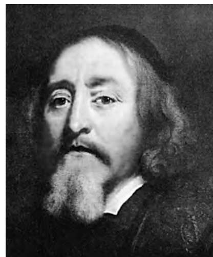
Jan Amos Komenský

Komenský Jan Amos (28. 3. 1592 Nivnice u Uherského Brodu – 15. 11. 1670 Amsterdam), polyhistor, filozof, teolog, pedagog a spisovatel. 1608–1611 chodil do bratrské školy v Přerově, ve studiu pokračoval v Herbornu 1611–1612 a v Heidelbergu, 1614 učil na bratrské škole v Přerově, 1616 byl vysvěcen na bratrského kněze a bylo mu svěřeno řízení bratrského sboru ve Fulneku, kde působil do r. 1622. Po bělohorské porážce se ukrýval na různých místech č. zemí a nakonec odešel 1628 do exilu v polském Lešně, nakrátko byl v Londýně, 1642–1646 v Elblágu, 1650 pobýval