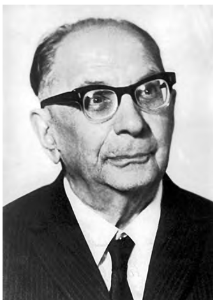
Pjotr Grigorjevič Bogatyřov

Bogatyřov Pjotr Grigorjevič , též Petr Bogatyřev (29. 1. 1893 Saratov, Rusko – 18. 8. 1971 Moskva), ruský slavista, etnograf a folklorista, literární vědec, jazykovědec a vysokoškolský pedagog. Studia na historicko-filologické fakultě univerzity v Moskvě ukončil 1918. Zprvu působil v Moskvě, od r. 1921 v Berlíně a od r. 1923