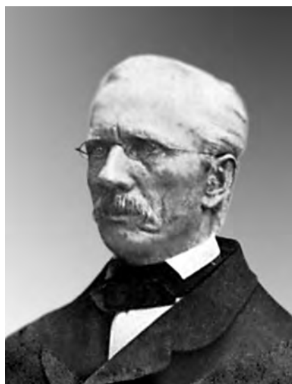
Karel Jaromír Erben