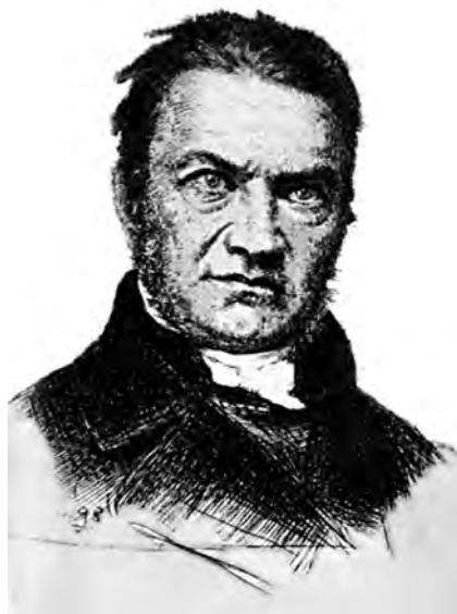
Pavel Jozef Šafárik