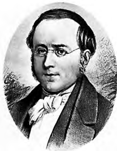
František Ladislav Čelakovský