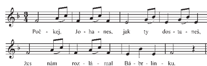
Tanec minet. Městec Králové, Suchý 1955, s. 171

s oblibou tancovala zvl. starší generace. – První taneční popisy m. pocházejí sice až z počátku 20. stol., avšak lze předpokládat, že i přes dlouhodobý variační proces byly uchovány jeho příznačné taneční prvky. Býval tancován většinou krokem sousedské nebo valčíku, časté bylo držení za ruce proti sobě, přičemž páry postupovaly bez otáčení dovnitř kruhu a zpět nebo po jiných půdorysných drahách, kdy ustupovala pozadu jen tanečnice a tanečník postupoval za ní. Tanec býval často provázen poklonami a projevy dvoření. Takto jej také charakterizovali současníci, kteří půvab tance spatřovali právě v tomto výrazu. M. měl i volnější formu s jedním typizovaným krokem tančným do kola bez