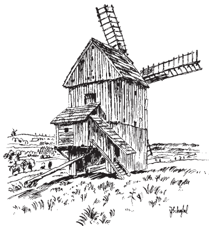
Romfeldův větrný mlýn. Litultovice-Choltice (Opavsko)

378 beraních, 117 holandských, 12 malých dřevěných a 379 neznámého typu; z tohoto počtu je 160 doloženo ve stabilním katastru (1827–1836, Hlučínsko 1861) a 87 před r. 1800. V Čechách bylo zjištěno 201 větrných mlýnů v 184 obcích (ve 27 obcích není větrný m. přesně doložen nebo lokalizován) a na Moravě a ve Slezsku 685 větrných mlýnů ve 483 obcích. V některých obcích tedy pracovalo několik větrných mlýnů. V poslední fázi svého vývoje větrné mlýny ponejvíce jen šrotovaly obilí, zděné mlýny se nakonec měnily v obydlí, rozhledny (za války často sloužily jako pozorovatelný) apod. K r. 1995 se v terénu a ve skanzenech dochovalo téměř 50 dřevěných a zděných větrných mlýnů z 18. a 19. stol. (většinou již bez složení), a to v Praze, dále ve středních (Berounsko, Kutnohorský, Mladoboleslavský, Příbramský), sev. (Děčínský, Jablonecký, Lounský) a vých. Čechách (Trutnovský) a na Moravě a ve Slezsku (Blanenský, Bruntálský, Frýdecko-Místecký, Hodonínský, Kroměřížský, Novojičínský, Opavský, Ostravský, Prostějovský, Přerovský, Třebíčský, Vyškovský, Zlínský, Znojemský). – K větrnému